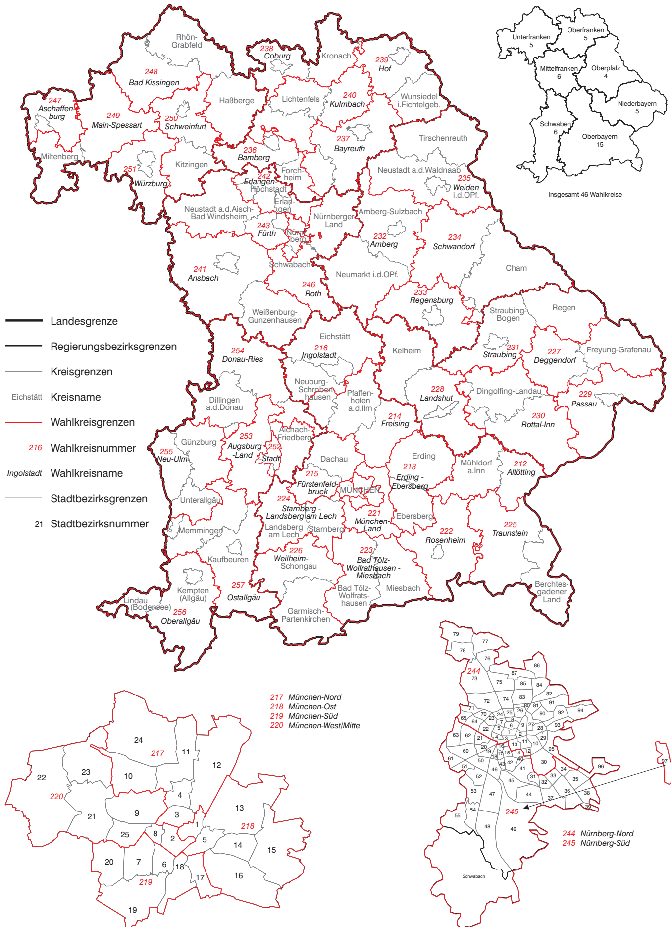
Abb. 1 Wahlkreise Bayerns zur Bundestagswahl 2021