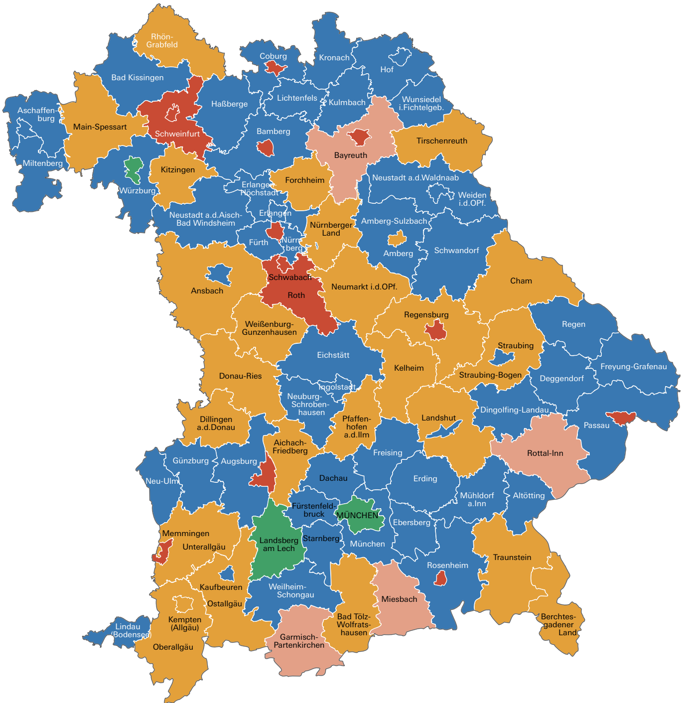
Abb. 1 Wahl der Oberbürgermeister in den kreisfreien Städten und Wahl der Landräte in den Landkreisen Bayerns Stand: 1. Mai 2026